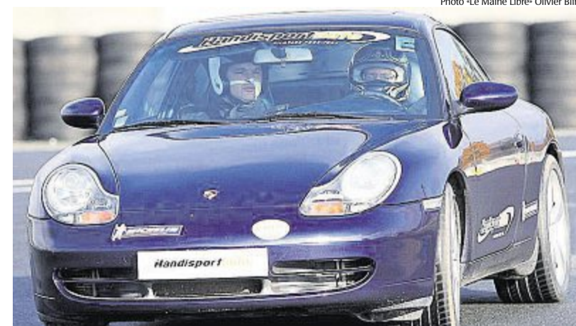
Associer les personnes handicapées aux valides, c'est aussi l'objectif d'Handisportauto.

nourrit le projet un peu fou « d'engager aux 24 Heures du Mans un équipage mixte valides/handicapés ». C'est